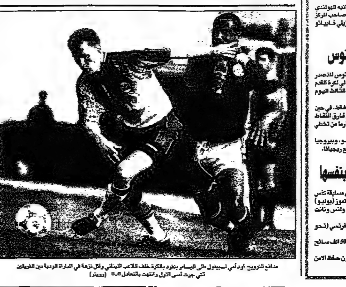
مباراة التنوع اودمي اسيفول في الساب بنور، والكرة خلف اللاعب اللبناني، اول زحمة في المباراة الودية بين اللاعبين التي جرت امس الاول وانتهت بالتعادل 0-0

روما - رويترز: تقام في مطلع اسبوع مباريات في اطار دوري الدرجة الاولى ايطالي لكرة القدم.